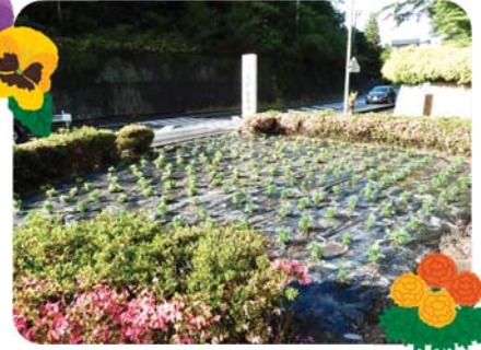
苗移植後の花壇 (大川葉桜会)