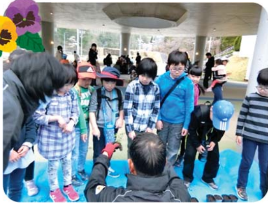
4/14 陶子連追跡ハイク サフィニアのポット移植