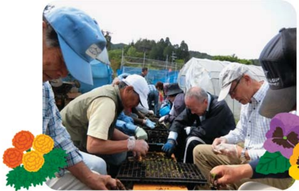
5/18 マリーゴールド、サルビアのポット移植