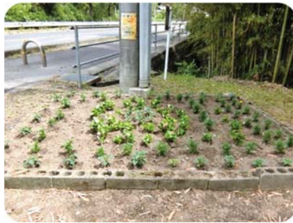
苗移植後の花壇 (水上第2長寿クラブ)