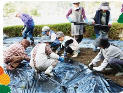
苗移植 (大川葉桜会)