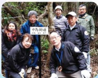
中馬街道の案内標識設置

ここ数年陶小学校6年生の皆さんと中馬街道を散策しています。今回コースは陶町全域。東町から大川までの中馬街道を巡り、石仏や史跡を見学しました。部会員の解説を真剣に聞き興味津々。積極的に質問もしてくれ、散策後には中馬街道に関する手書き新聞を作ってくれました。